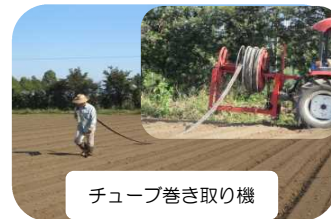
チューブ巻き取り機 散水器具省力化の現地実演 (H27. 10)