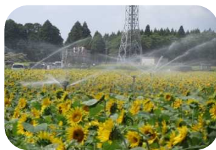
地域イベントでの散水実演 (H27. 8)