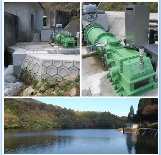
小水力発電施設と青鹿ダム

自然の恵み、水の大切さを肌で感じる良い機会となりますので、希望される方は、御連絡をお願いします。