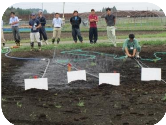
川南町通山・坂の上地区 (H27.8)