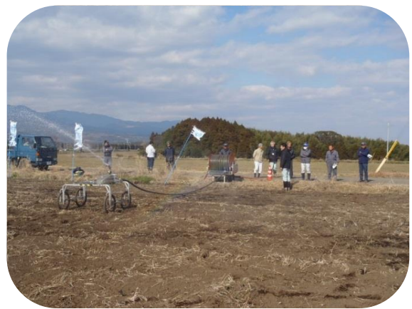
川南町西光原・国光原地区 (H28.1)